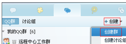
图 7.1 创建 QQ 群

如何创建 QQ 群呢？使用 2011 版本的 QQ 客户端，在群用户界面上，点击“创建”按钮；在下拉菜单选择“创建群”（图 7.3）。