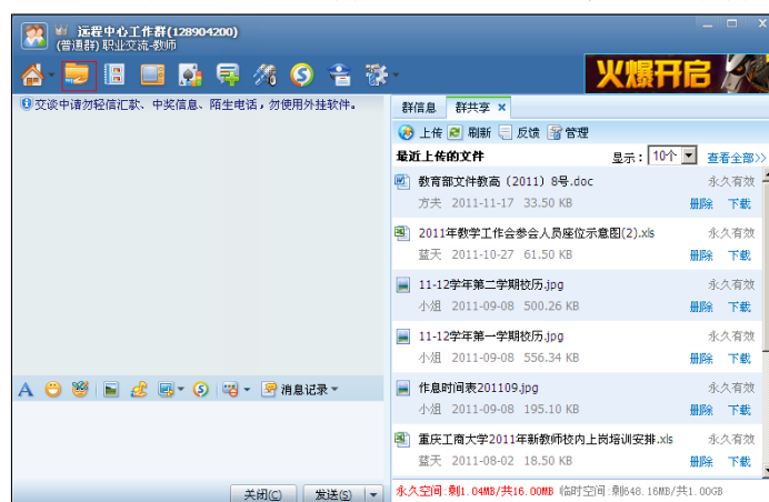
图 7.4 群共享文件窗口

点击聊天窗口右上部红框标注的“群共享文件”图标，就打开了群共享文件窗口（图 7.6）。在这个窗口下，群内用户可以上传或下载群内共享文件。