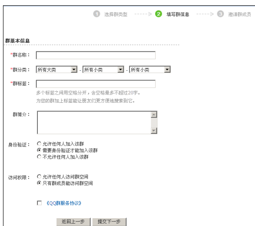
图 7.2 填写群信息

在弹出页面中点击“创建新群”链接后，在新的页面中选择群类型；选择完群类型后，就可以填写群信息（图 7.4）。