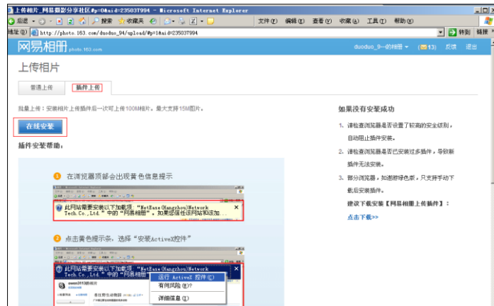
图 7.5 插件安装页面

(5) 插件安装。点击“插件上传”标签后，再点击“在线安装”按钮，并按照插件安装页面（图 7.15）下部的“插件安装帮助”提示进行操作，就可以安装图片上传插件。