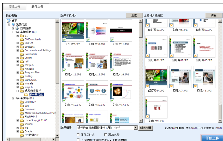
图 7.6 插件上传方式操作界面

(7) 浏览相册。点击相册名称进入相册，就可以在线浏览相册照片（图 7.17）。