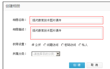
图 7.3 创建相册窗口

按钮，这样便建立了一个新的相册，如图 7.13 中的“现代教育技术图片课件”相册。