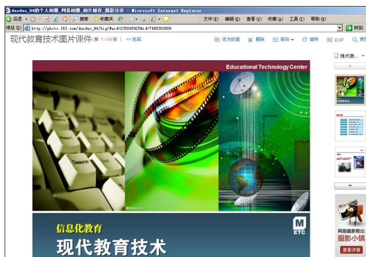
图 7.7 浏览相片

(7) 浏览相册。点击相册名称进入相册，就可以在线浏览相册照片（图 7.17）。