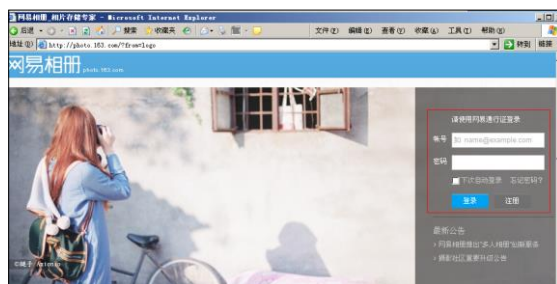
图 7.1 网易相册首页面

(2) 登录相册。在 IE 浏览器的地址栏内填写下面的网址， http://photo.163.com/ ，打开登录界面。分别用 163 信箱的用户名及密码直接填入登录框内（也可以是 126 信箱及 yeah 信箱的）（图 7.11）。点击“登录”按钮，即可打开网易相册界面（图 7.12）。