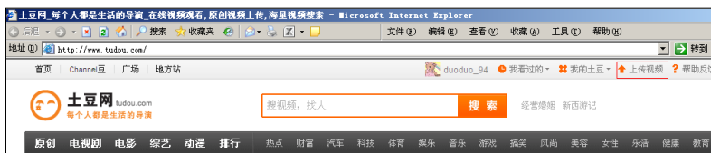
图 7.1 土豆网用户操作界面

在上传个人视频资源前需先在视频资源分享网站上注册用户。注册完成并登录后，就进入图 7.19 所示的用户操作界面（以土豆网为例）。点击页面右上部的“上传视频”菜单，就打开了视频上传页面（图 7.20）。