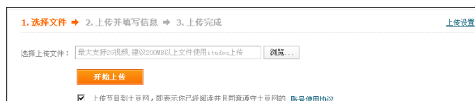
图 7.20 土豆网视频上传页面

点击“浏览”按钮，选择本地要上传的视频文件，再点击“开始上传”按钮，系统就开始文件上传操作。在文件上传的过程中，可以编辑上传视频文件信息，简述文件内容，选择文件分类（图 7.21）。文件上传成功且文件信息填写完成后，点击“保存”按钮，即可完成文件上传操作。