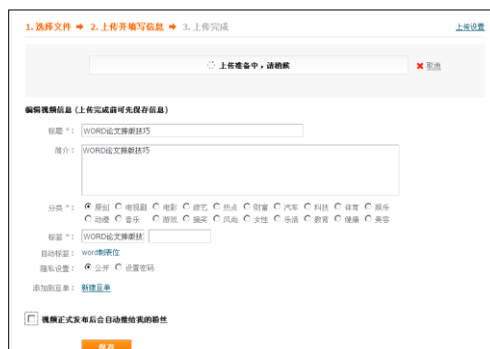
图 7.21 视频信息编辑页面

点击“浏览”按钮，选择本地要上传的视频文件，再点击“开始上传”按钮，系统就开始文件上传操作。在文件上传的过程中，可以编辑上传视频文件信息，简述文件内容，选择文件分类（图 7.21）。文件上传成功且文件信息填写完成后，点击“保存”按钮，即可完成文件上传操作。