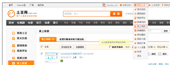
图 7.22 查看已上传的视频文件

视频上传完成后，用户可以在“我的土豆”菜单下，通过点击“我上传的”菜单来查看用户上传的视频文件（图 7.22）；再点击视频文件名，就可以打开视频播放页面（图 7.23）。