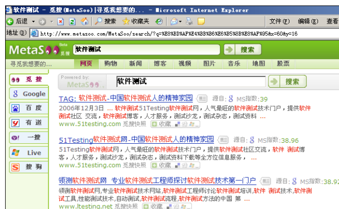
图 6.3 元搜索引擎搜索结果