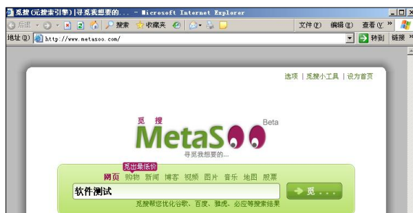
图 6.2 觅搜搜索引擎

常用的元搜索引擎有觅搜（ http://www.metasoo.com ）、搜魅（ http://www.someta.cn ）等。下面以觅搜网为例，介绍如何实现一次获得多个搜索引擎的搜索结果。打开觅搜网的首页面，在输入框中输入检索主题词后提交，检索结果如图 6.18 所示。